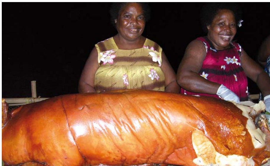
Vet is wat telt in Papoea Nieuw Guinea.